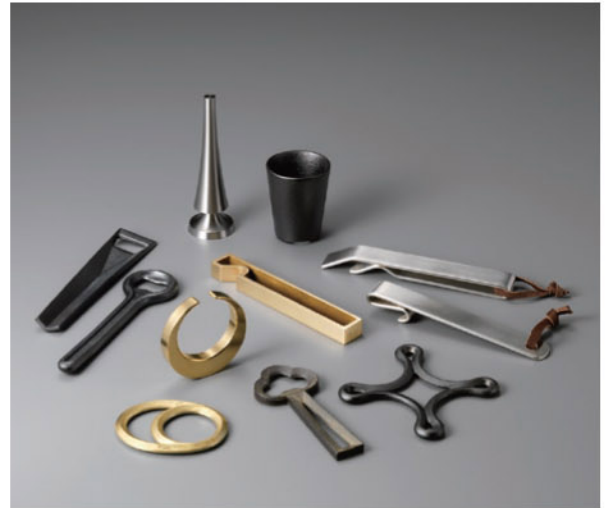
センヌキデザインプロジェクト《センヌキ各種》2009年

本展覧会では、こうした日本のものづくりを担う気鋭のプロダクトデザイナーらに注目し、いわゆる今日のMade in Japanを生み出す優れたデザインと道具を紹介します。