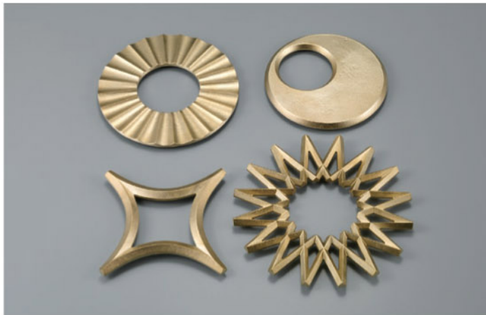
大治将典《編敷き:月、太陽、銀河、星》2009年