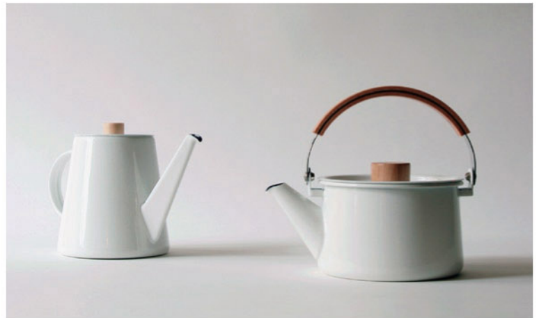
小泉 誠《kaico ドリップケトル、ケトル》2005年