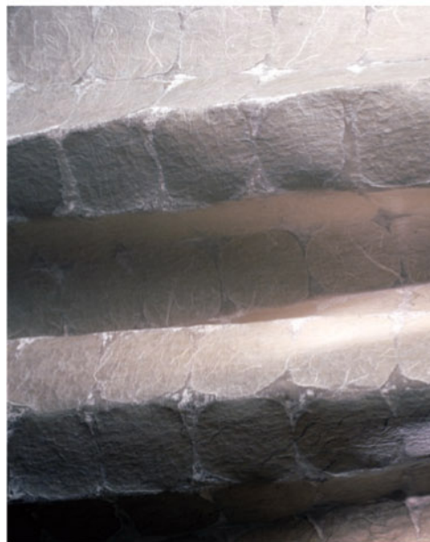
須藤玲子《和紙垣》2013年 [表面図版]